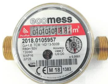
Рис. 2 Лічильник води Picoflux